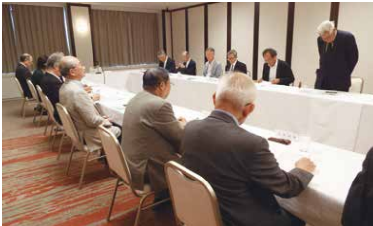
最近の評議員会（平成29年6月28日）