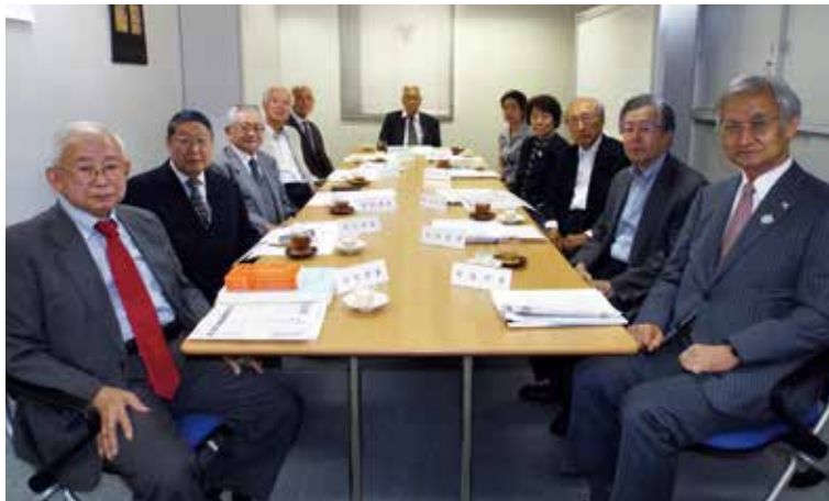
最近の役員会（平成29年9月26日）