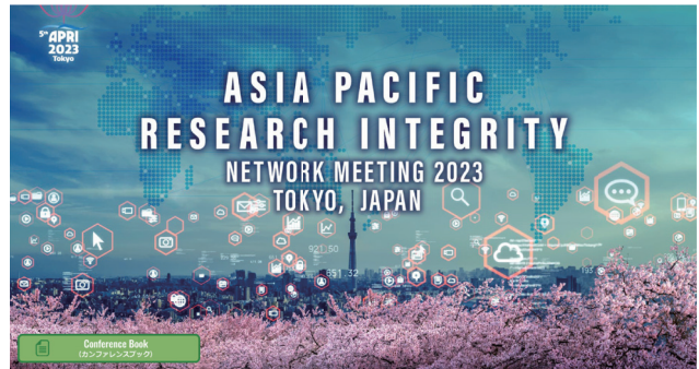
図1 APRI2023の公式サイト ( https://www.apri2023.org )

本調査研究は、アジア太平洋地域の研究公正を推進するための国際的なボランティア組織であるAsia Pacific Research Integrity Network (APRI)のメンバーを共同研究者に迎えて行いました。APRIは、これまでに米国(2016年)、香港(2017年)、台湾(2018年)、韓国(2021年)で国際会議を開催してきました。一般財団法人公正研究推進協会は、本調査研究を実施する場として第5回目の会議(APRI2023)(2023年3月20-22日、早稲田大学)を主催しました。